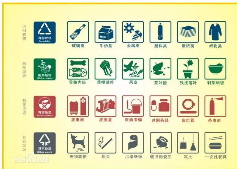
图 2-2 垃圾分类标准